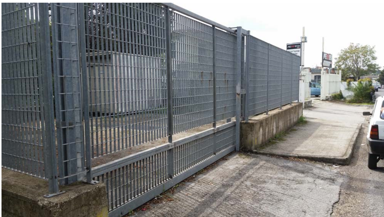
Fotografia 02 – Vista esterna