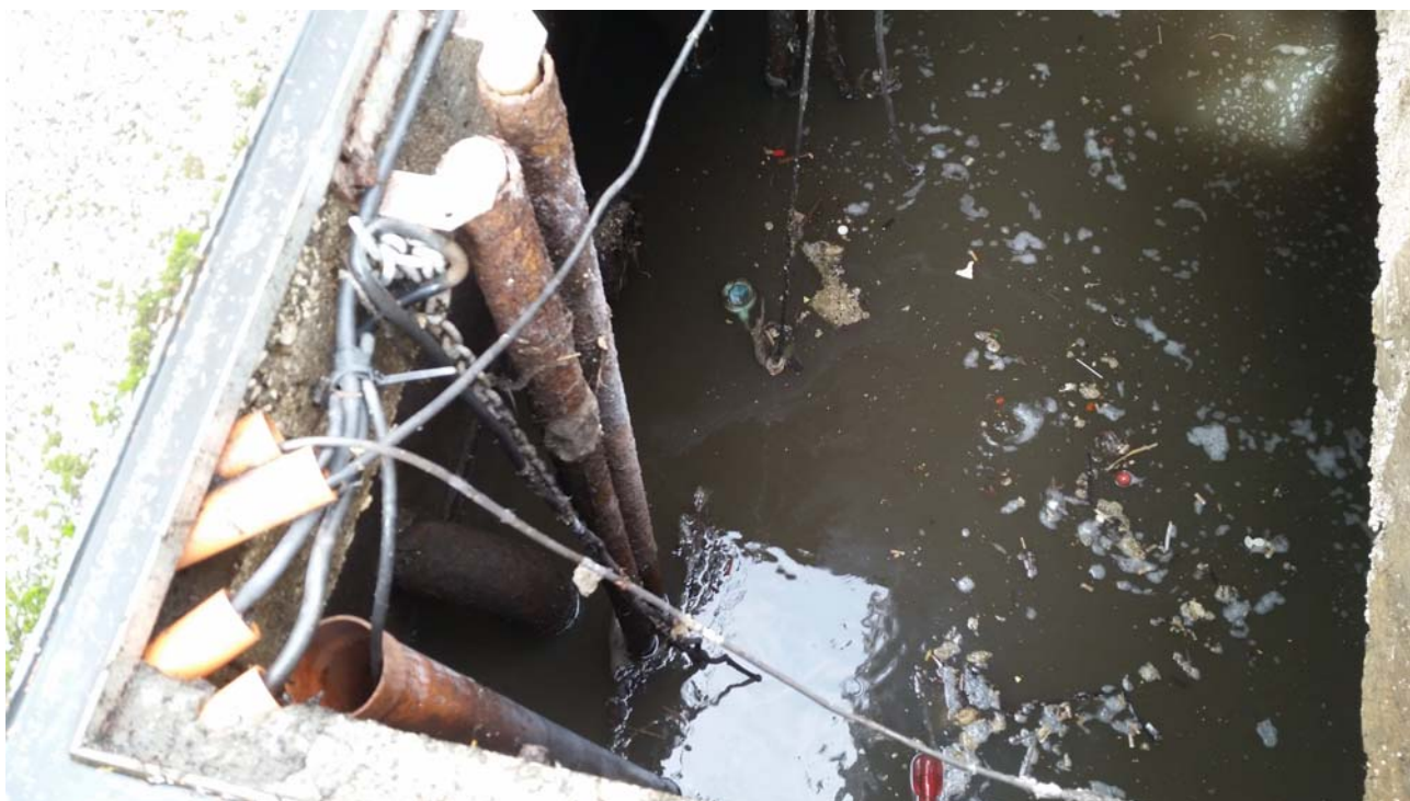
Fotografia 03 – Vasca alloggiamento elettropompe