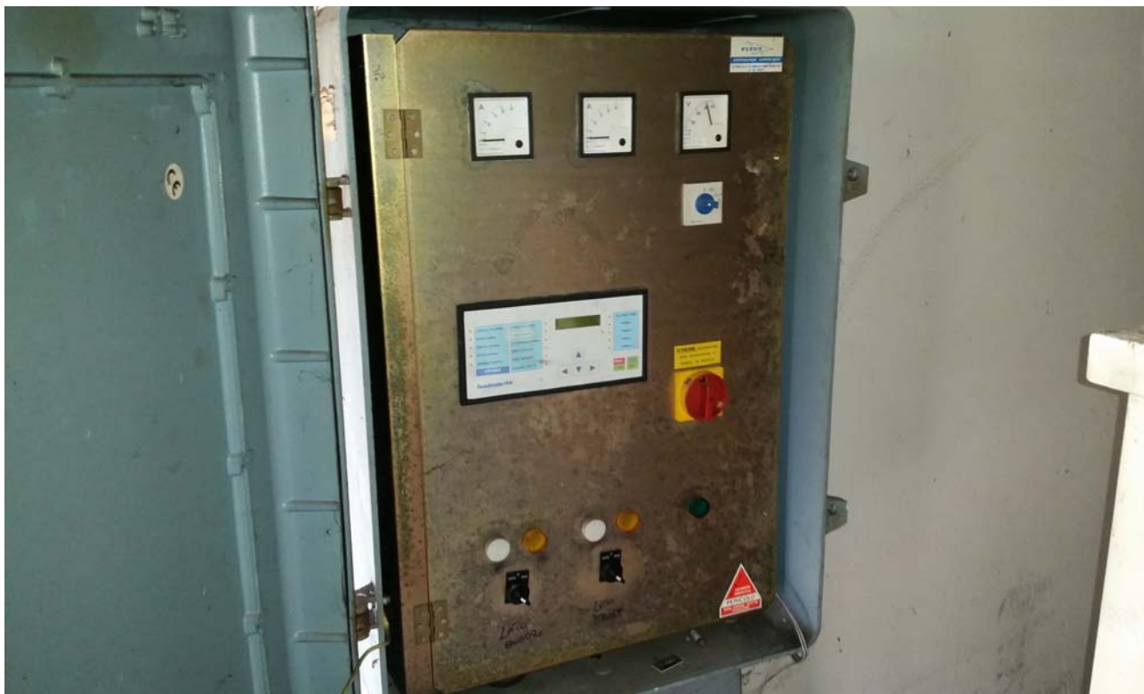
Fotografia 06 – Misuratore Enel e quadri elettrici