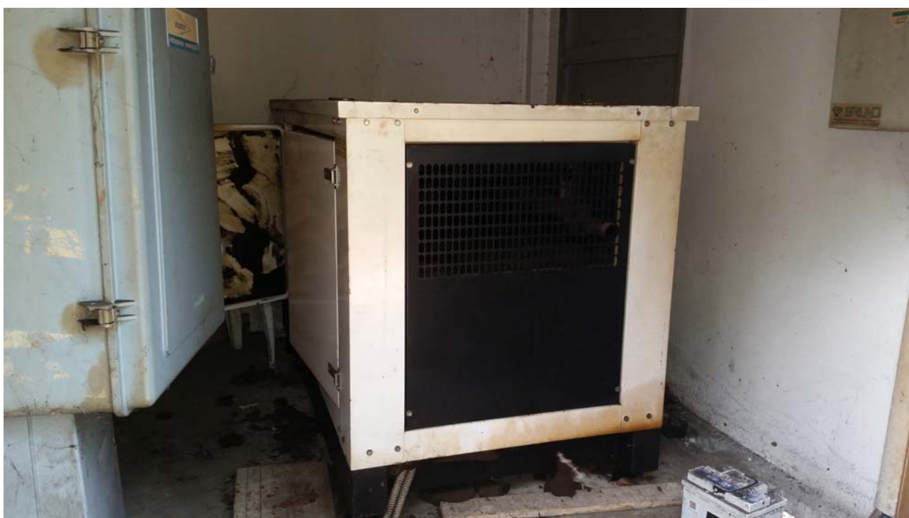
Fotografia 08 – Gruppo elettrogeno di sicurezza