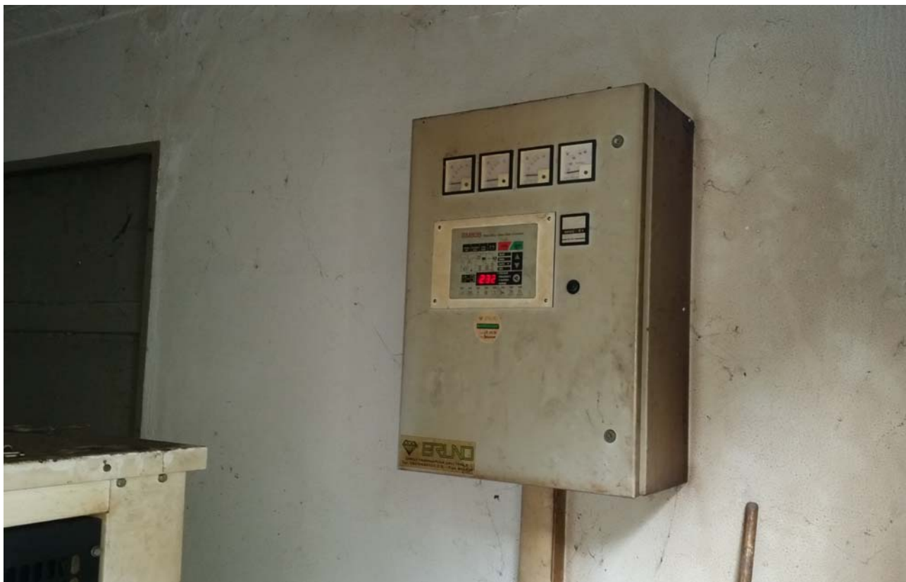
Fotografia 05 – Misuratore Enel e quadri elettrici