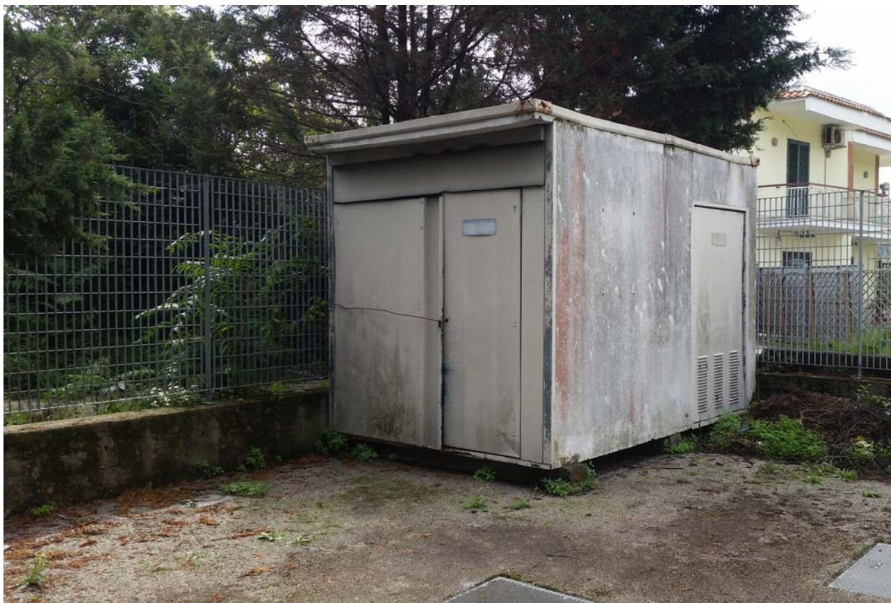
Fotografia 07 – Misuratore Enel e quadri elettrici