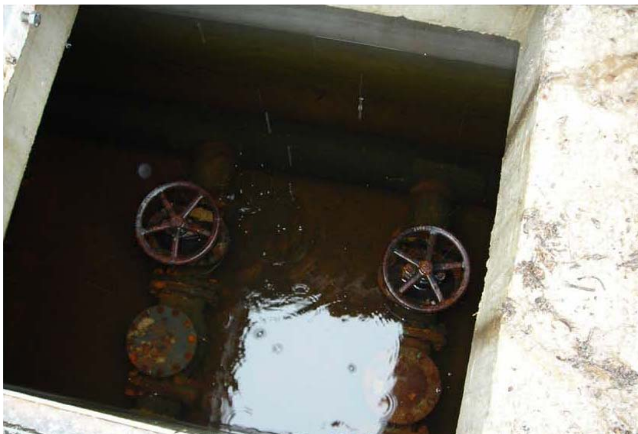
Fotografia 04 – Camera di manovra