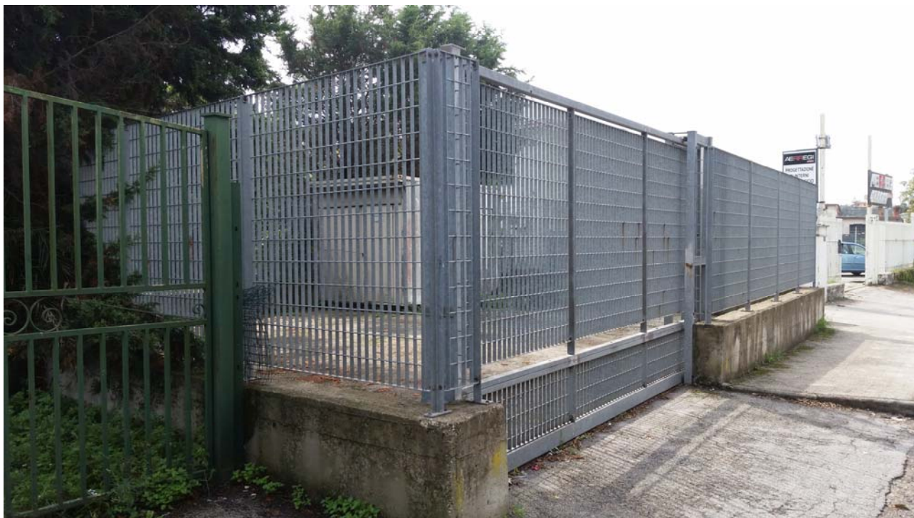
Fotografia 01 – Vista esterna

Nel presente paragrafo si riportano alcune fotografie relative all'impianto nei punti più significativi dell'impianto di sollevamento di Monteruscello .